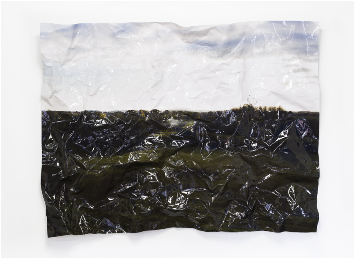
Froissé 01. Tirage photo froissé. Dimensions 125x175 x 12 cm.

C'est un tirage photographique de grandes dimensions représentant un paysage, que j'ai volontairement froissé.